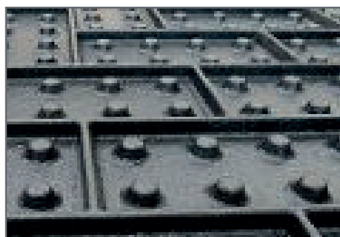
Unterseite: Luftpolster mit Gummistegen